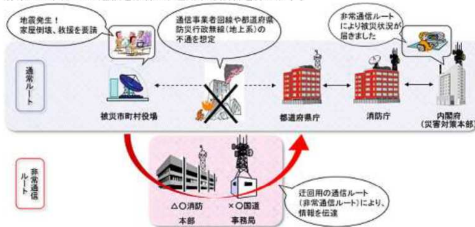
図1 非常通信訓練の概要

電気通信事業者回線が不通となる等、通常の通信網では被災地から国までの情報伝達ができなくなる事態を想定し、他機関が保有する自営通信網を活用することで、被災地から都道府県又は国までの通信を確保し、運用する訓練を行います。